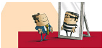
Фототизинг обманщиков безармянано. Современные технологии и социальные

Если вам «гарантируют» десятки или даже сотни процентов в год без всякого риска, это точно обман.