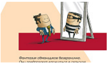
Фантазия обманчивое безразлично. Она подводит даже самых успешных и опытных.

Если вам «гарантируют» десятки или даже сотни процентов в год без всякого риска, это точно обманство. Вас просят приводить новых клиентов И обещают заплатить процент от их вклада. Так преступники пытаются побыстрее развести как можно больше людей в свою аферу, собрать с них деньги и скрыться.