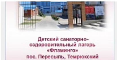
Детский санаторно-оздоровительный лагерь «Фламинго» пос. Пересыпь, Темрюкский