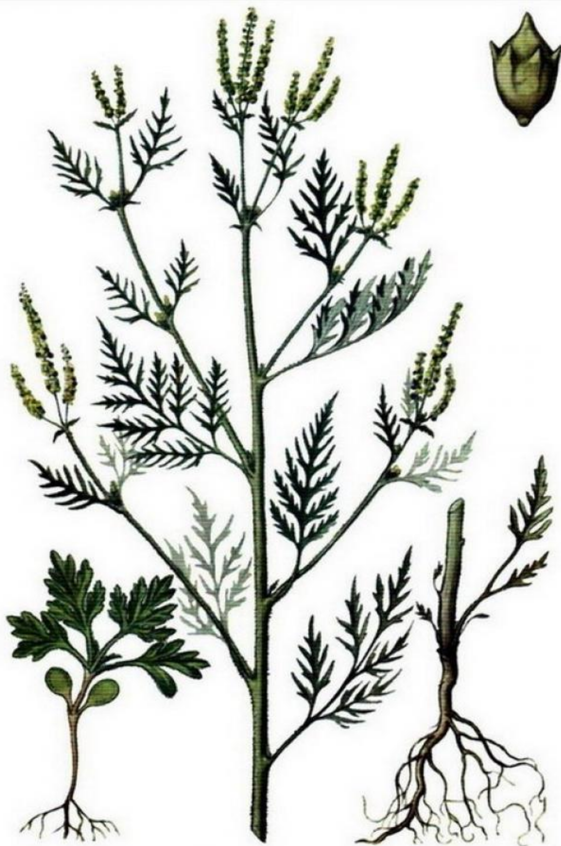
АМБРОЗИЯ ПОЛЫННОЛИСТНАЯ ( Ambrosia artemisiifolia L.)